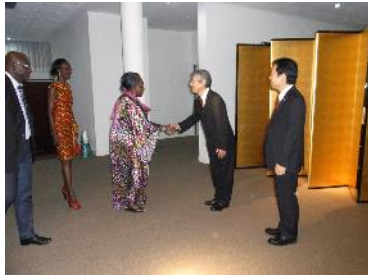
SEM INOUE Susumu, Ambassadeur du Japon accueillant les invités