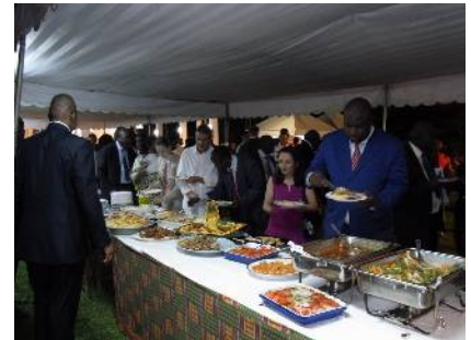
Dégustation de mets japonais et ivoiriens

La communauté japonaise en Côte d'Ivoire, a célébré par anticipation, le mardi 10 décembre 2013, la fête nationale de son pays à Abidjan. L'Ambassadeur du Japon, SEM INOUE Susumu, a d'abord remercié les personnalités ivoiriennes, les ambassadeurs et les chefs de missions diplomatiques ainsi que ses compatriotes vivant en Côte d'Ivoire pour leur présence nombreuse qui témoigne de leur amitié et attachement au Japon. L'Ambassadeur a ensuite expliqué que la fête nationale du Japon est célébrée normalement, le 23 décembre de chaque année. Cette date est l'anniversaire de Sa Majesté AKIHITO, Empereur du Japon. La famille impériale ayant toujours été le symbole de l'unité nationale au cours de la longue histoire du pays, les japonais célèbrent leur fête nationale à la date anniversaire de Sa Majesté l'Empereur du Japon. Le 23 décembre 2013 marque le 80 e anniversaire de sa majesté Akihito. Il a ensuite rappelé que la célébration de cette fête est aussi l'occasion de mentionner l'excellence des relations entre le Japon et la Côte d'Ivoire. En effet, les relations diplomatiques entre les deux pays ont été établies dès l'accession de la Côte d'Ivoire à l'indépendance en 1960. Cela fait donc 53 ans que les deux pays ont des relations bilatérales très étroites. Dans ce sens il a salué la participation de Son