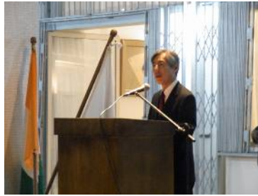
Allocution de SEM INOUE Susumu, Ambassadeur du Japon