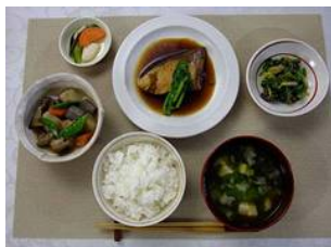
Mets traditionnels japonais : « washoku »

Le « washoku » est une pratique sociale basée sur un ensemble de savoir-faire, de connaissances, de pratiques et de traditions japonais liés à la production, au traitement, à la préparation et à la consommation d'aliments. Il est associé à un principe fondamental de respect de la nature étroitement lié à l'utilisation durable des ressources naturelles. Les connaissances de base ainsi que les caractéristiques sociales et culturelles associées au washoku sont généralement visibles lors des grandes cérémonies, notamment lors des fêtes du